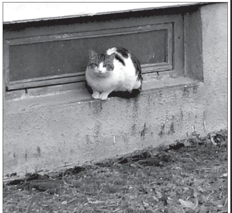
Daugybė beglobių gyvūnų šala ir šlampa lauke nesulaukdami pagalbos.